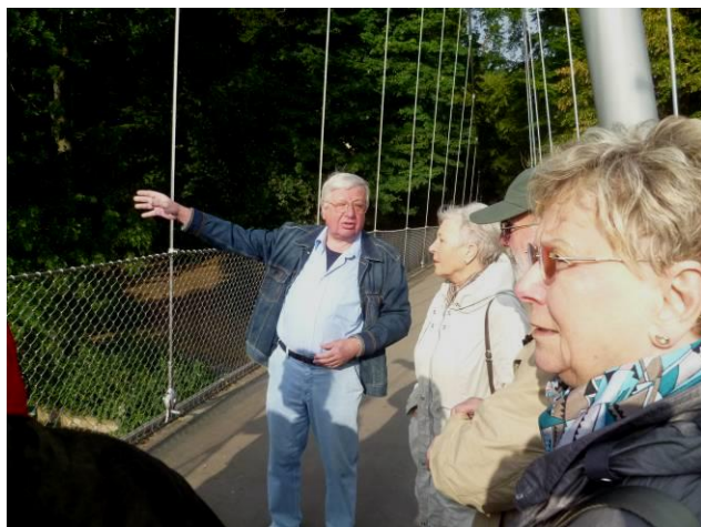
Treffen an der Glacisbrücke

angriffen, und dass das Proviantmagazin originalgetreu wieder aufgebaut wurde und besichtigten zum Schluss den Mindener Dom, der als karolingischer Dom etwa 805 gegründet wurde, bis 1648 Bischofskirche des Bistums Minden war und mehrfach grundlegend umgebaut und erweitert wurde. Nach seiner fast 100 %igen Zerstörung am 28. März 1945, wenige Tage vor dem Einmarsch der Alliierten, wurde er unter Leitung von Werner March von 1950 bis 1957 wieder aufgebaut. March war einer der prominentesten Architekten im Nationalsozialismus und Architekt des Berliner Olympiastadions. Er leitete auch den Wiederaufbau des Mindener Alten Rathauses.