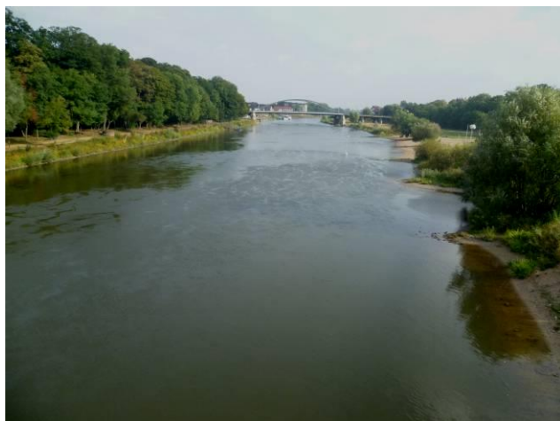
Weserblick nach Norden