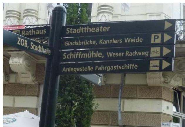
Wegweiser zur Stadt