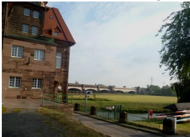
Wesertal, Blick zum Kanal

Zügig ging es weiter zum Wasserstraßenkreuz, wo der Mittellandkanal in 13 m Höhe die Weser überquert. Gut erkennbar sind die zwei Pfeiler, die 1945 kurz vor dem Einmarsch der Alliierten von deutschen Truppen gesprengt wurden. Der Kanal lief bis zu den nächsten Sperrtoren leer. Mit bösen Folgen. Bei unserem Besuch war es ruhig. Nur in der Ferne waren Schiffe zu sehen.