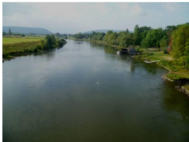
Weserblick zur Porta Westfalica

Die weitere Folge der Ereignisse war derart informativ, dass dem Berichterstatter die Worte fehlen. Wir erfuhren eine Menge über die Geschichte dieser Stadt, in der Widukind und Karl der Große auch eine Rolle spielen, hörten von Kultur und dem 1908 im Jugendstil erbauten Theater, durften selbst die Herkunft des Namens Minden nachlesen, stiegen Treppen zwischen Unterstadt und Oberstadt aufwärts und abwärts, bestaunten alte Häuser, wobei die Museumszeile und das „Windloch“ besonders erwähnt wurden, erfuhren von den schweren Bomben-